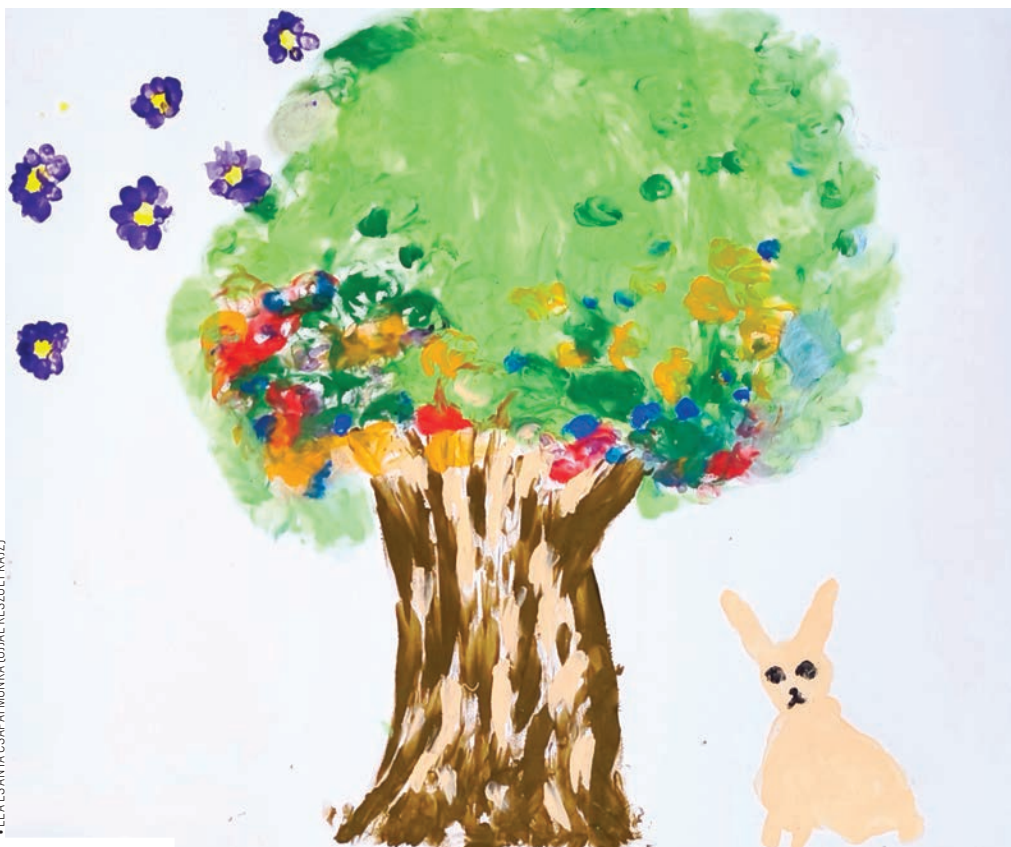
A fa és a nyuszi