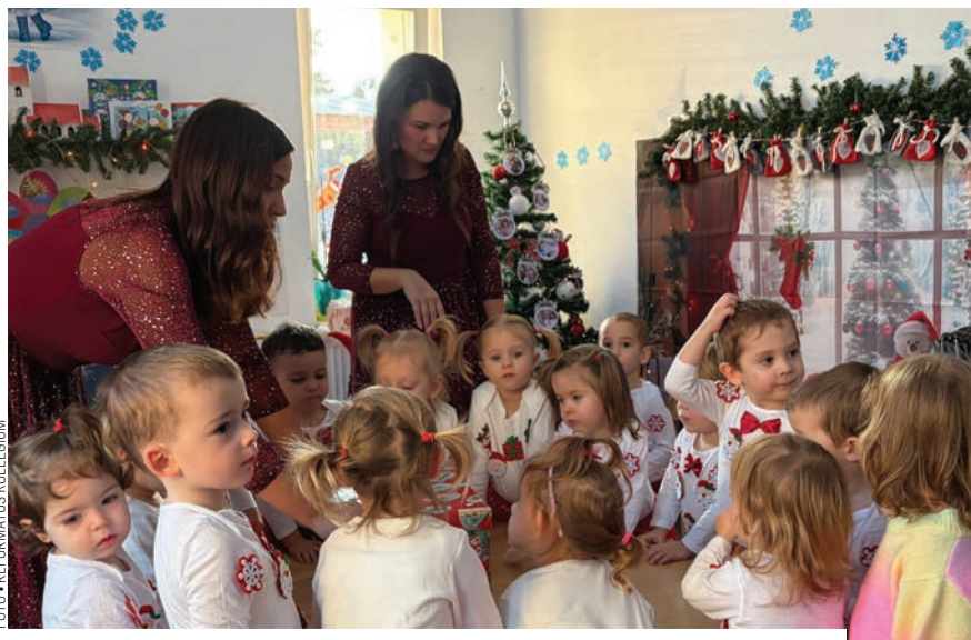
A vásárhelyi refi a bölcsődétől a posztliceumi oktatásig szinte mindent lefed

vonatkozik. Tiszta szerencse, hogy az egyházkerület megértette a helyzetet, és további két dadust alkalmazott. Hótt nem az ő kötelessége a kisegítő személyzetet fizetni.