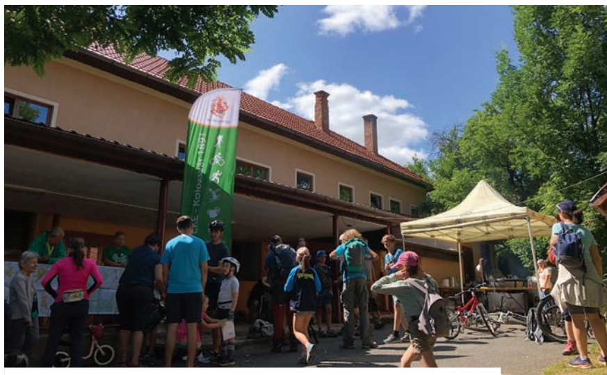
Reggeli pezsgés a kalotaszentkirályi rajtban a Bánffy-teljesítménytúrán

a zöld hét alkalmával többször is vezetünk már túrákat iskolásoknak, akik közül sokan még soha nem túráztak Kolozsvár környékén. A statisztikai adatok azt mutatják, hogy az egyetemisták korcsoportja hiányzik a leginkább rendezvényeinkről, őket tudjuk a legnehezebben megszólítani, de a kamaszokat sem