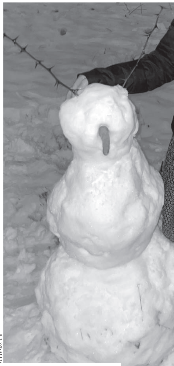
FOTÓ • KISS JUDIT

Bármennyire nem szeretem a telet, hideget, urambocsá' a havat sem, a gyerekek örömet, csillogó szemét, kipirult arcát látva, ahogyan a hétvégi szánkózás lebeg lelki szemeik előtt, ahogyan tiszta szívvel tudnak örülni a mármár csodaszamba menő hónap, elgondolkozom azon, hogy milyen egyszerű, és mennyire kevés dolog kell a