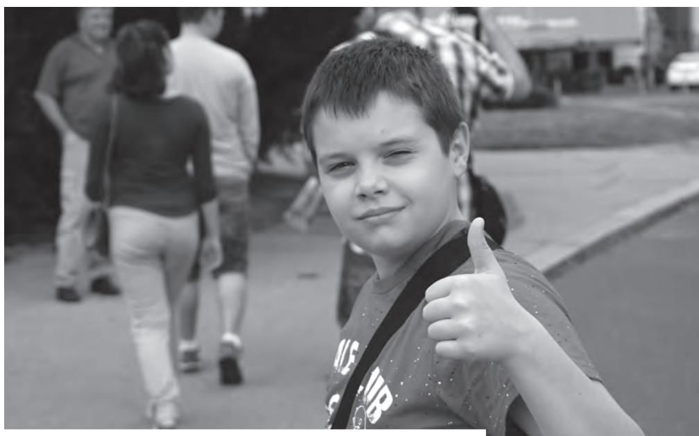
Tanulás a „való világban”. Ha a feladatok interaktívak, ha az iskolán kívüli tevékenységeket is bevonják, a diákok örömmel elvégzik ezeket

megpróbálják elmozdítani a hagyományos megközelítést. „A mai világban akkor lehet igazán eredményes egy tanár, ha segítőtje a diáknak, nem pedig frontálisan oktat” – összegezte Szőcs-Torma Katalin. Abban bíznak, hogy hosszú távon hozzájárulnak ahhoz, hogy csökkenjen a korai iskolaelhagyás, javulnak a diákok eredményei, és az elfogadás szintje a közösségekben. Oda kell eljutnunk, olyan oktatás-nevelést kell nyújtunk a tanintézetekben, hogy a gyerekek szívesen, örömmel járjanak oda. Ehhez képest jelenleg gyakran ennek éppen az