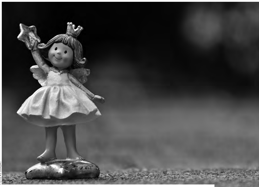
„Az ünnep megszakítja ezt a hajszát, megtöltheti lelkünket kedvességgel és odafigyeléssel”

– Fontos szempont lehet a túlterheltségtől való megszabadulás is, ami szín-