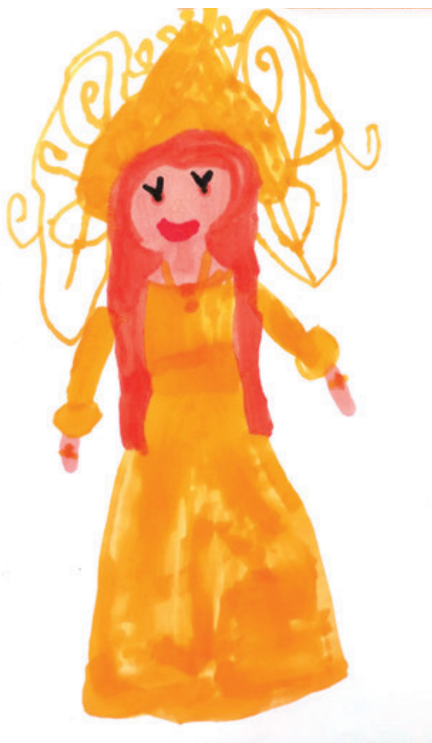
Utazó hercegnő 2. (Anya)

az addig. Bár volt „tengerünk”, nekem ezúttal nem voltak ilyen gondjaim, mert a Ligur-tenger vize elég hideg volt ahhoz, hogy önmagában is határt szabjon a ki-be koslatásnak.