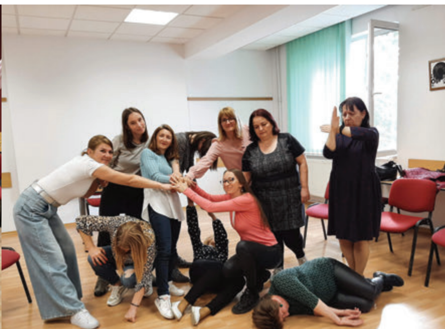
FOTÓK • BORDÁS ANDREA