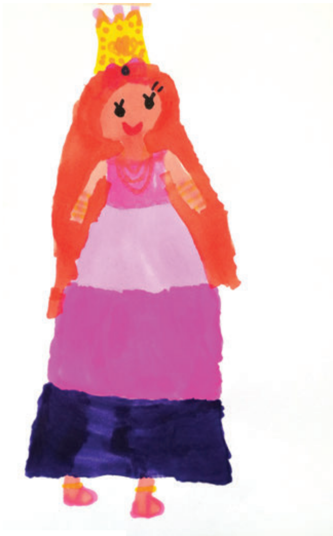
Utazó hercegnő 1. (Lea)