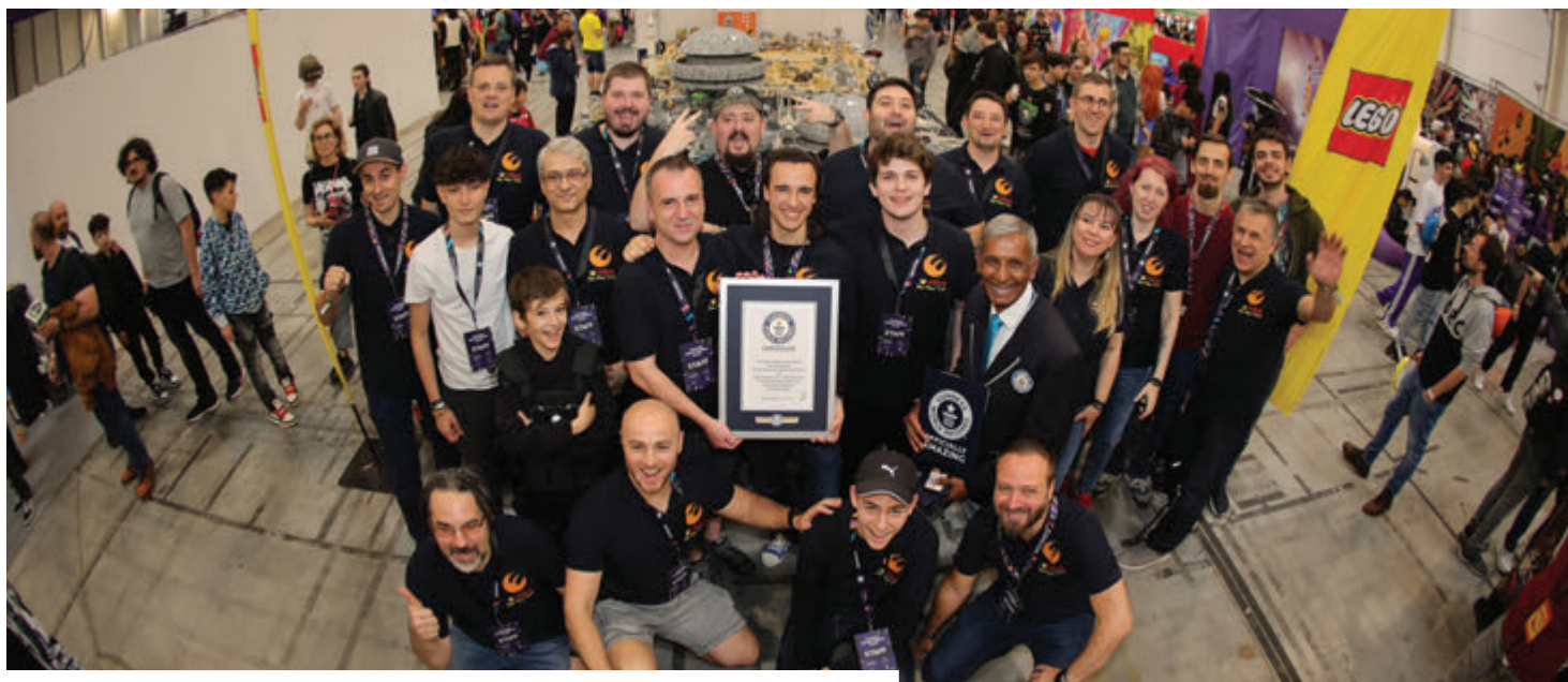
A RoLUG csapat tagjai szeretnék minél szélesebb körben ismertetni a díjazott diorámát

gimnazista fia közösen meséltek a Bukarestben április 19–21. között szervezett East European Comic Con (EECC)