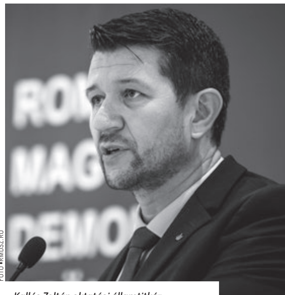
Kallós Zoltán oktatási államtitkár

felfelé lehet. Szerinte a törvényes keret már megvan, de minden oktatási intézménynek a számára megfelelő, lehető legjobb stratégiát kell alkalmaznia annak érdekében, hogy az oktatás minősége egyre jobb legyen, és hogy tudjuk tartani a lépést a társadalom és technológia fejlődésével. „Az elfogadhatatlan, hogy az iskola a 30-40 évvel ezelőtti