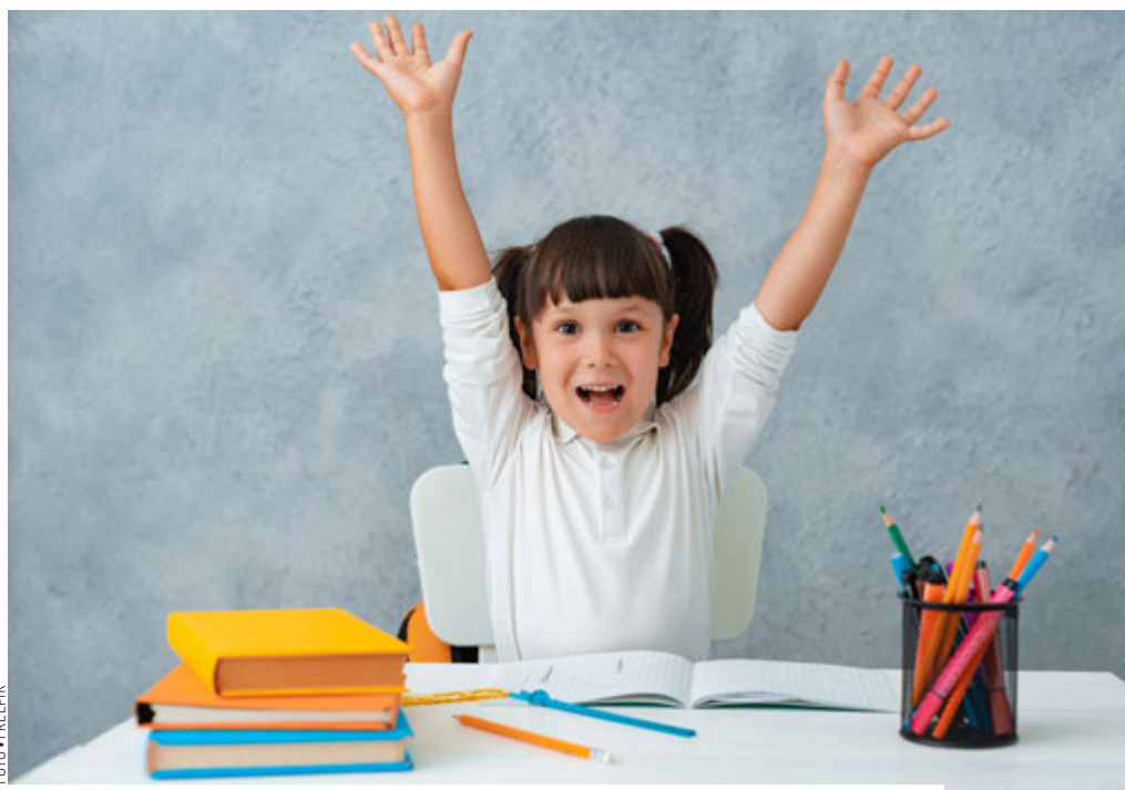
Nem igaz, hogy „mai gyereket” semmi nem érdekl, ha játékosan, örömmel tanítunk, fel lehet lelkesíteni

Keresztretjvényt fejtettünk közösen, és mikor a többség ugyanarra a beírandó szóra szavazott és nem az volt a nyerő, jött a következő mese. Vagyis: egy szobában van száz ember, ki kell jutniuk