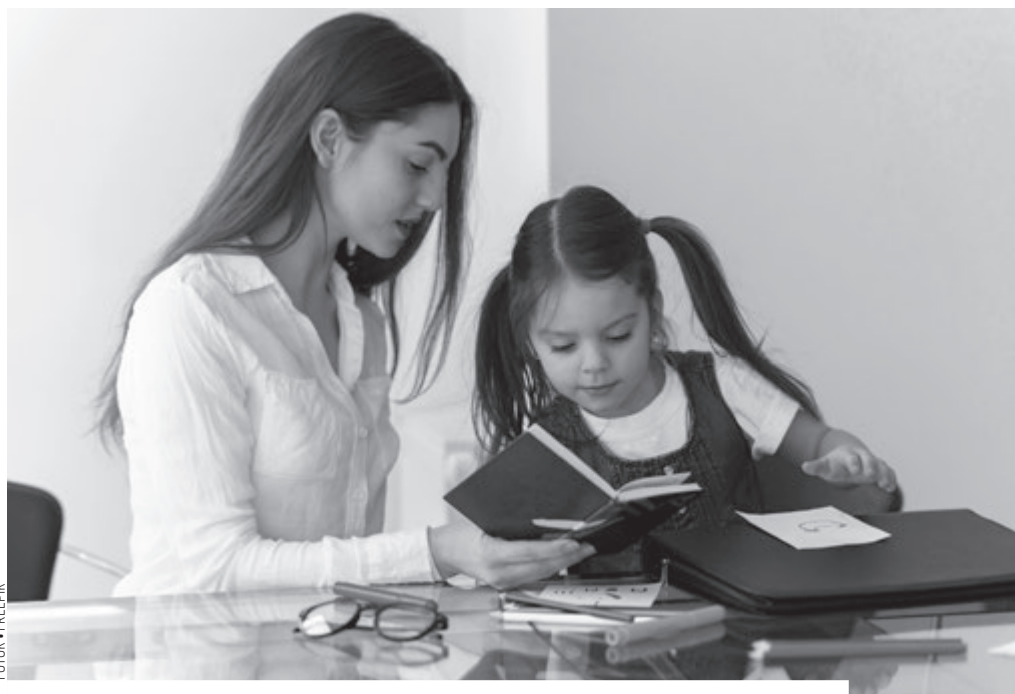
Problémák mindig voltak és lesznek, amikben a megoldás lehetőségeire kell összpontosítani

Természetesen nekünk, tanítóknak még nehezebb ez az út, mivel egy osztályban sokszor közel 30 diák is lehet. Mindegyikük külön egyéniség, más-más temperamentummal, akikkel sokszor teljesen különbözően kell egy-egy helyzetben viszonyulnunk annak érdekében, hogy pozitív, biztonságos, bizalomteljes kapcsolatot tudjunk