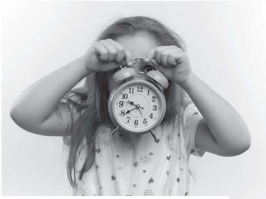
Egyesek szerint azért járunk nyolcra iskolába, mert a legtöbb szülő nyolcra jár dolgozni, és az nem lehet, hogy otthon egyedül lézengjen a sok gyerek

És persze, ha az ember földrajzórán az utolsó padban alszik, akkor nem írja be a földrajzfüzetbe, hogy Házi feladat: lerajzolni: Déli-Kárpátok. És ily