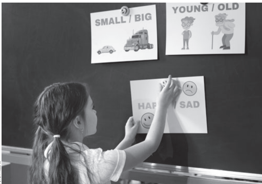
„A gyerekek egyre hamarabb kezdik használni az angol nyelvet kommunikáció céljából, ami nagyon jó dolog”

Rengeteg olyan csatorna, videó van a YouTube-on, amelyek hasznosak és tanító jellegűek. Én is kihasználom az ezekben rejlő lehetőségeket. De csak gondoljunk bele, mi, felnőttek milyen könnyen kalandozunk el adott esetben annak ellenére, hogy konkrét céllal ültünk le a képernyő elé. Második és főleg harmadik osztályban – mivel a gyerekek íráskészsége szépen kialakul ekkorra – az előbbieken említett játékos tanulás mellett fokozatosan egyre