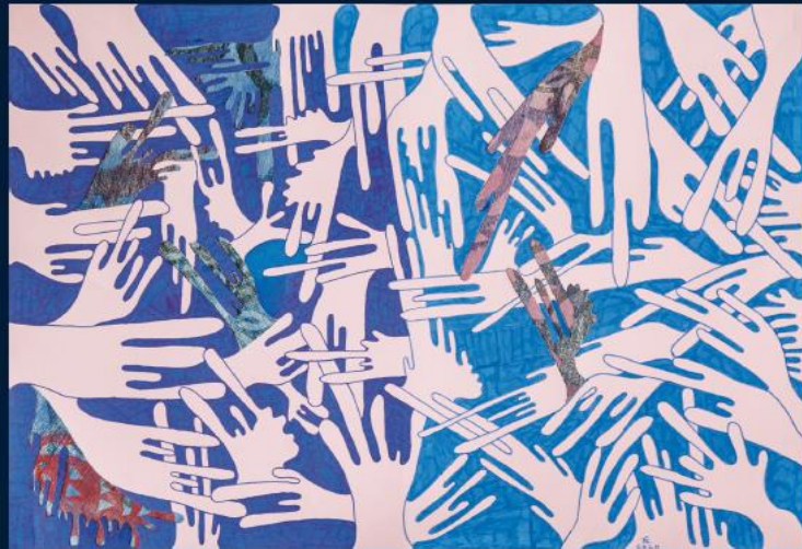
Kezekkel álmodok 50 x 70 Vegyes technika 2020