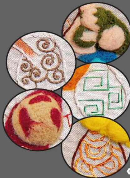
Szól a szellő 60 x 80 Vegyes technika 2022