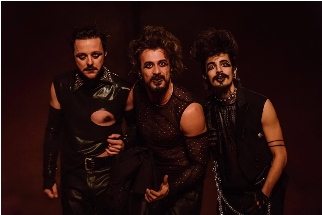
Csongor és Tünde, Rendező: Kányádi György, Ördögök