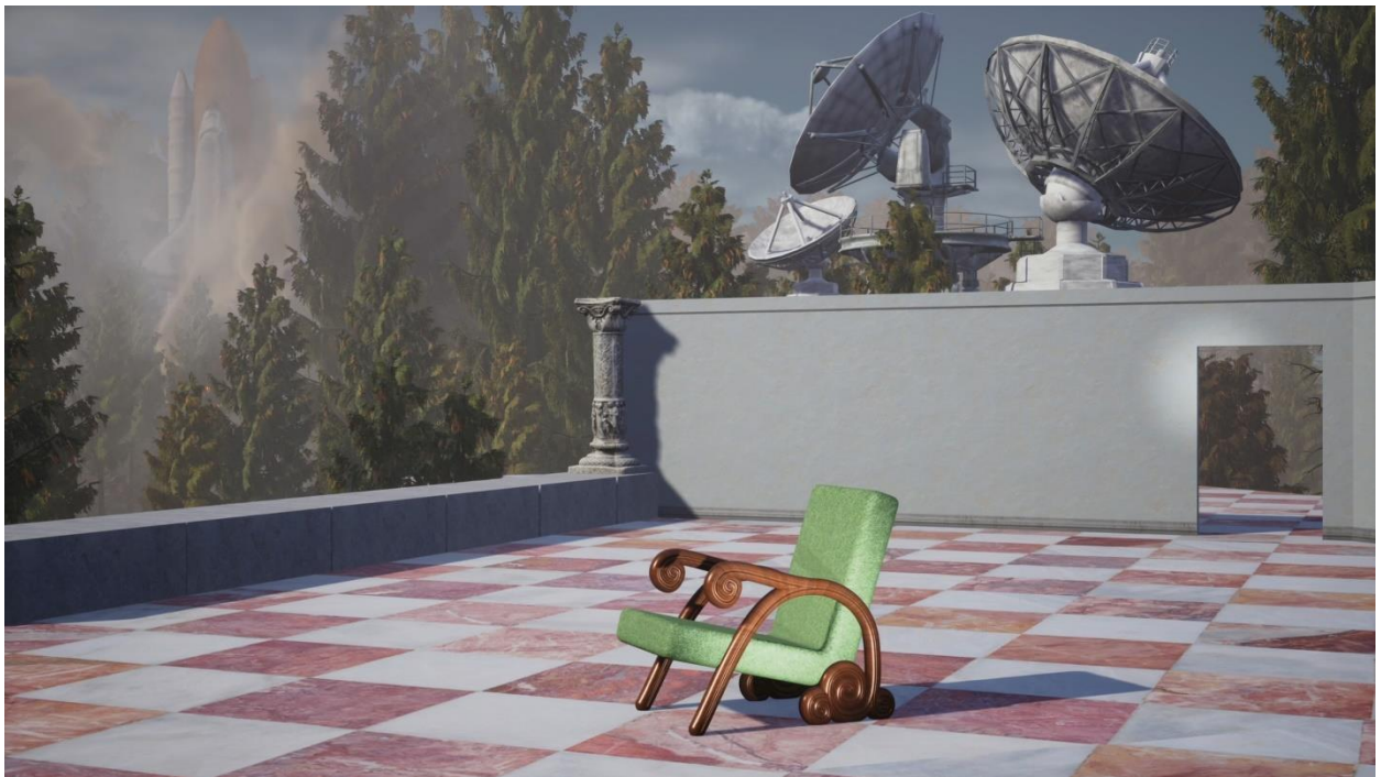
Millions of ruins