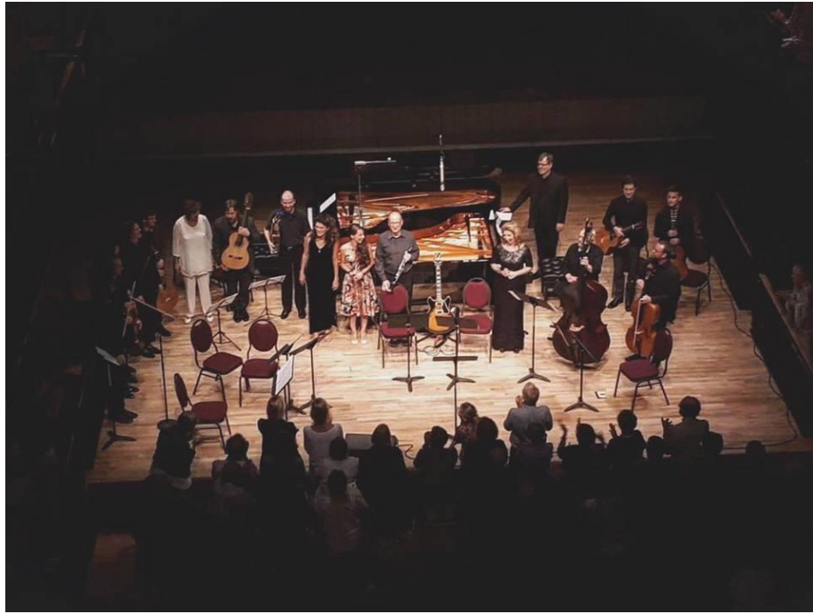
Parry Soundban a Festival of the Sound c. koncertsorozatunk zárókoncertje.