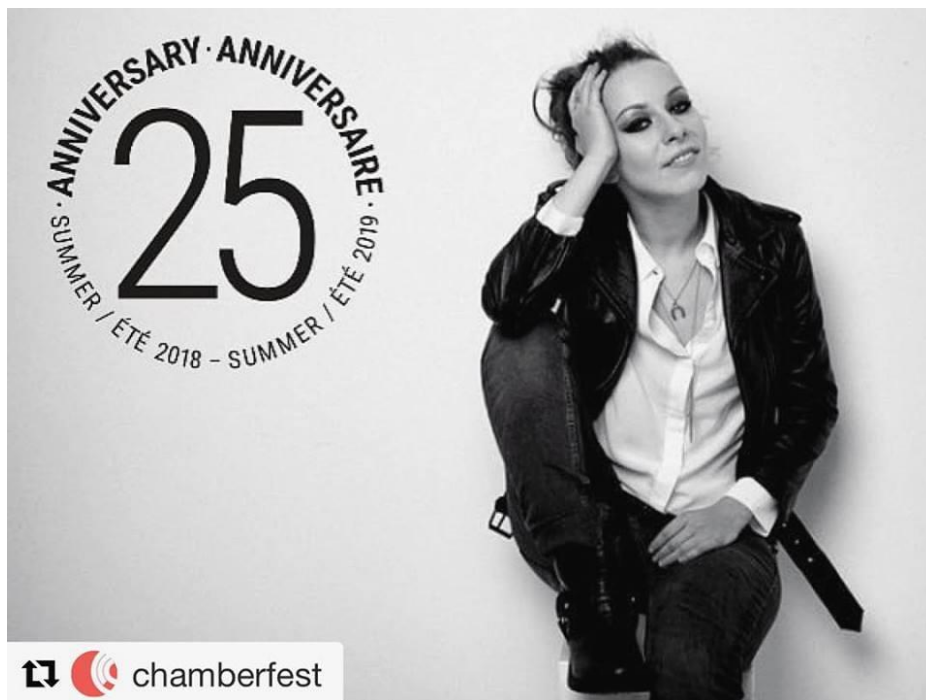
Ottawa Chamberfest keretén belül egy plakát velem.