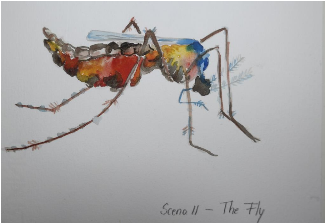
Scena 11 - The Fly