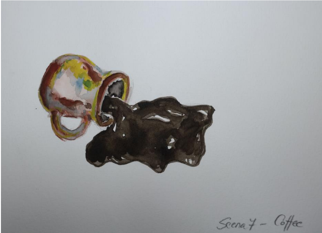
Scena 7 - Coffee