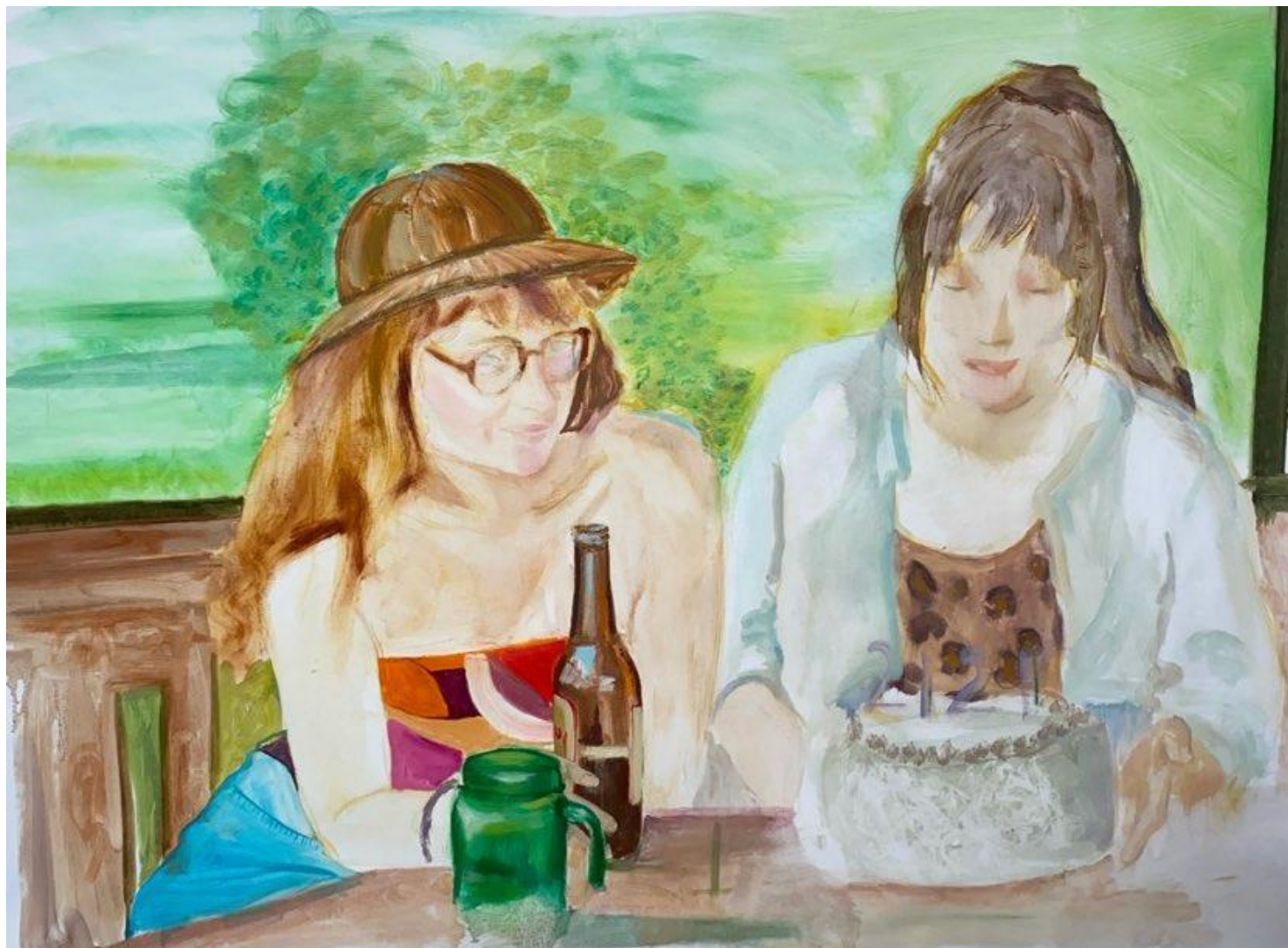
„21, it's just a number”