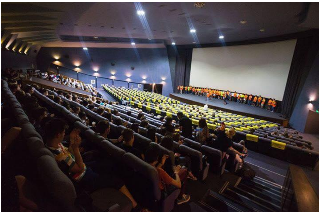
Határaink c. film bemutatója a Florin Piersic moziban, Kolozsvár