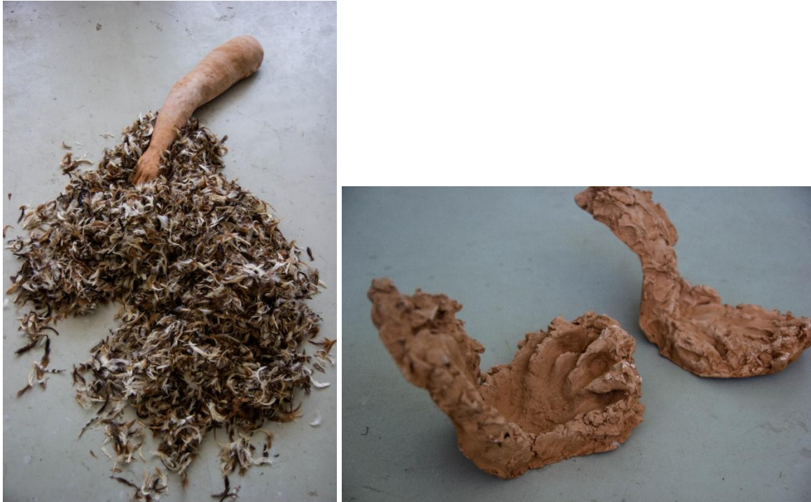
Tollúfosztás, 170x80x30cm, 50x50x30cm, terrakotta és tyúktollú, 2023

A kéz motívum megjelent eddigi munkáimban is, a régi hagyományos tollúfosztással hozva összefüggésbe. Az üvegből készült kezek sorozata, az ösztöndíj megpályázása után terracotta kezekkel is bővült. A velük szoros kapcsolatban levő tollukat pedig én téptem.