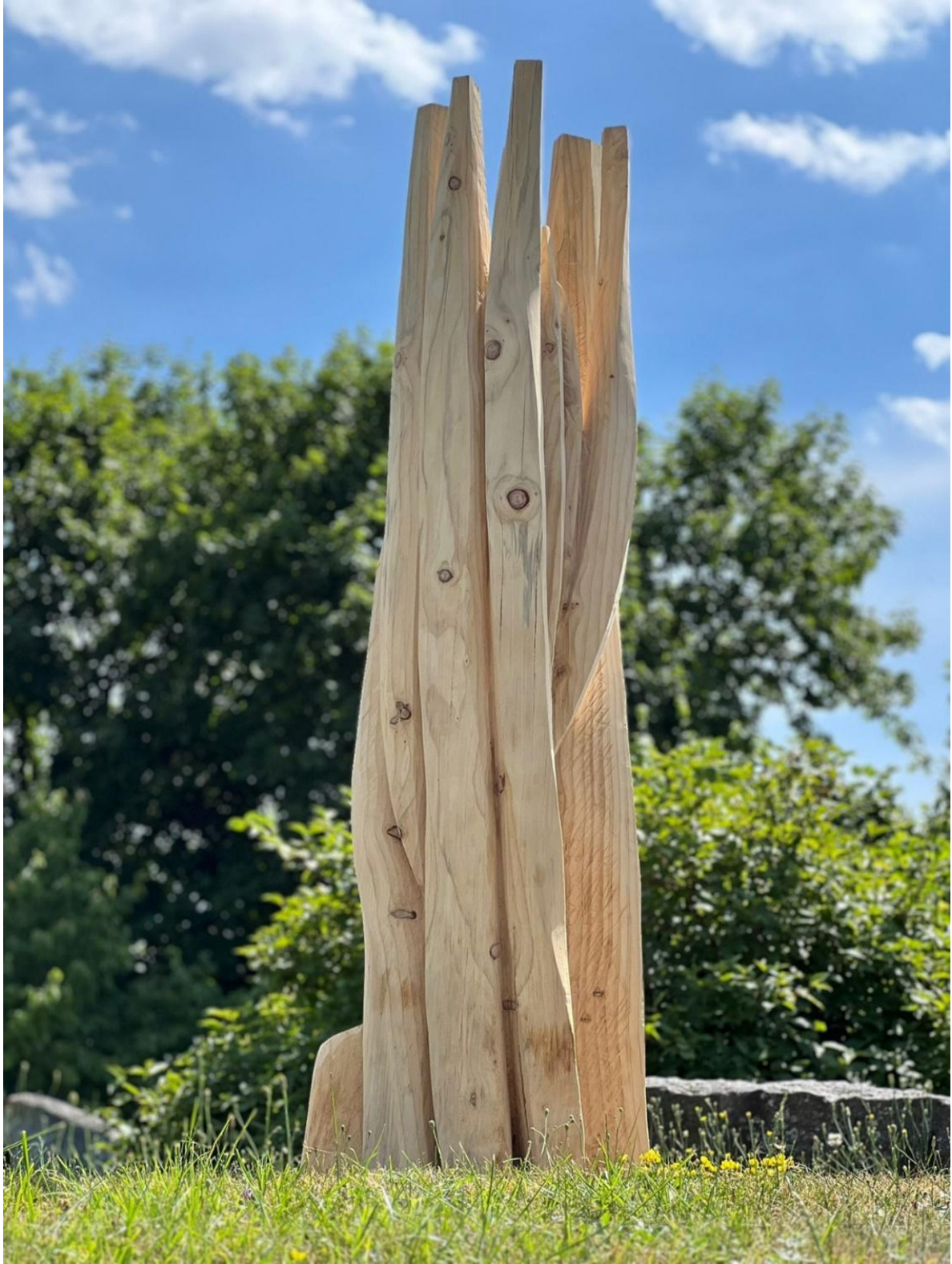
Kezek, 200x100x100 cm, fa, 2023