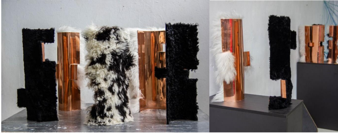
Konfiguráció, 50x35x70cm egyenként, vörösréz és báránybunda, 2023

A réz munkáim formavilágát követve, nagy mennyiségű méhviaszt volt lehetőségem vásárolni. Ennek köszönhetően kísérleteztem és különböző szobrokat formáltam. Bár szerettem volna bronzba önteni ezeket a hullámokat, megszerettem az eredeti anyagot s úgy döntöttem, hogy (még) nem vetem alá a viaszveszejtési technikának. Ugyanakkor, ezt a természetes anyagot a báránybundával társítottam a következőképpen: ahogy az alkotói tervezetemben is említettem, a bundát a forró viaszba mártva mintáztam. Végleges anyagát bronzban nyerte el.