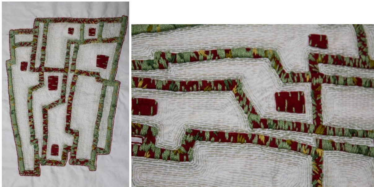
Labirintus, 50x50x50 cm pamut anyag és cérna (kézzel varrva), 2024