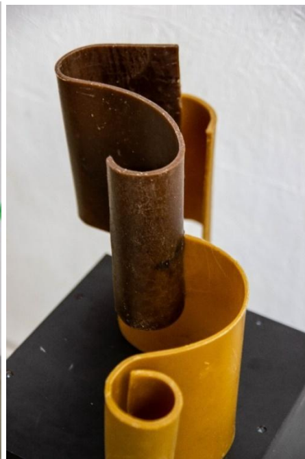
Spirál kísérletek, 70x50x40 cm, 60x50x30 cm, méhviasz, 2023