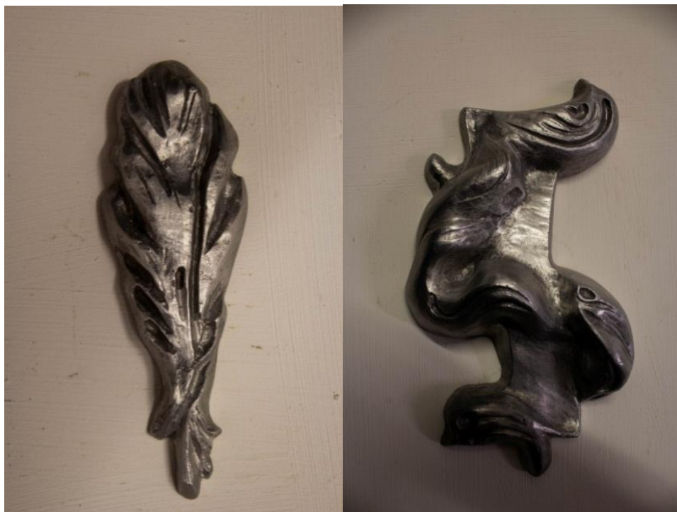
Emlékek Macerataról, 20x10x5cm, alumínium, 2023