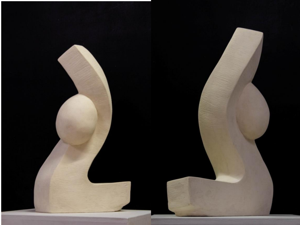
Absztrakt utam, 70x30x30 cm, műgyanta, 2023