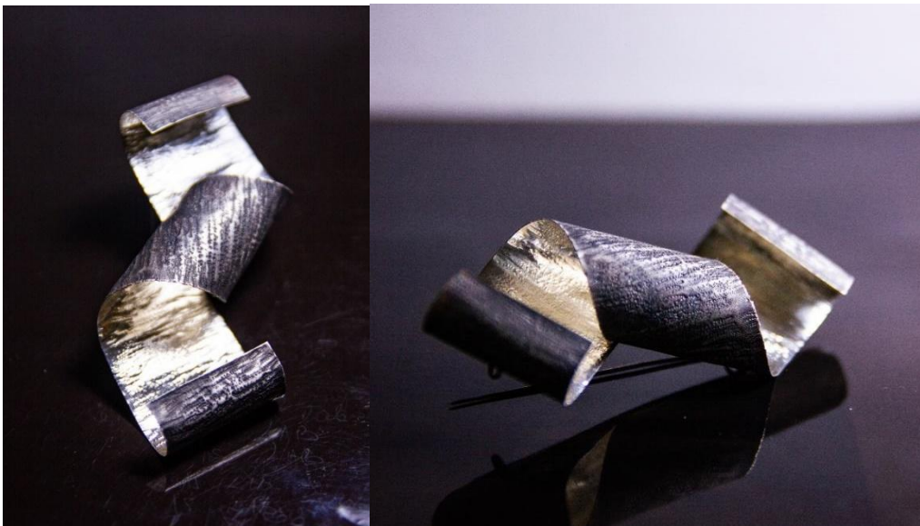
Bross, 10x5x3 cm, ezüst,2023

Egy nagyon jelentős évet tudhatok magam mögött. Nem csak a magánéletemben, de a vizuális művészetekben, a szakmai életemben is építő jellegű változásokon mentem keresztül. Az elmúlt éves tevékenységem két fejezetre osztható. Az első szakaszban, az alkotói tervezetben leírtakat követve készítettem el az alkotásaim nagy részét. Az juttatás rendkívül fontos volt az anyagok és eszközök megvásárlásában. A vörösréz és az ezüst, valamint a báránybundák finanszírozása bizonyult a legkölségesebb feladatnak.