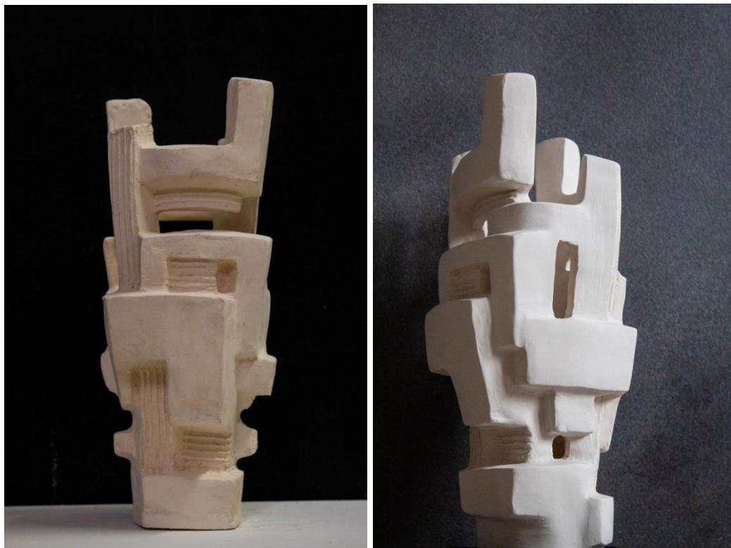
Labirintus, 25x12x14cm, egyik műgyanta, másik fehér terrakotta, 2024