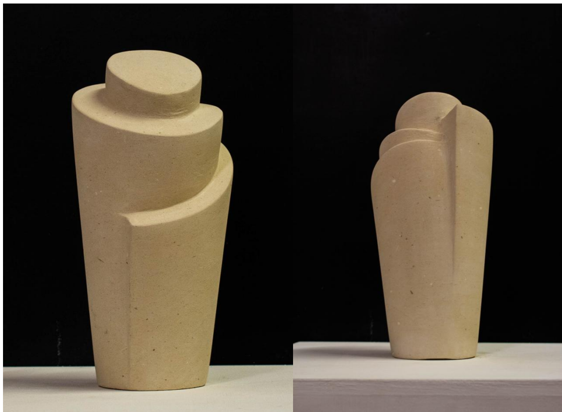
Kőspirál, 30x13x13 cm, homokkő, 2023