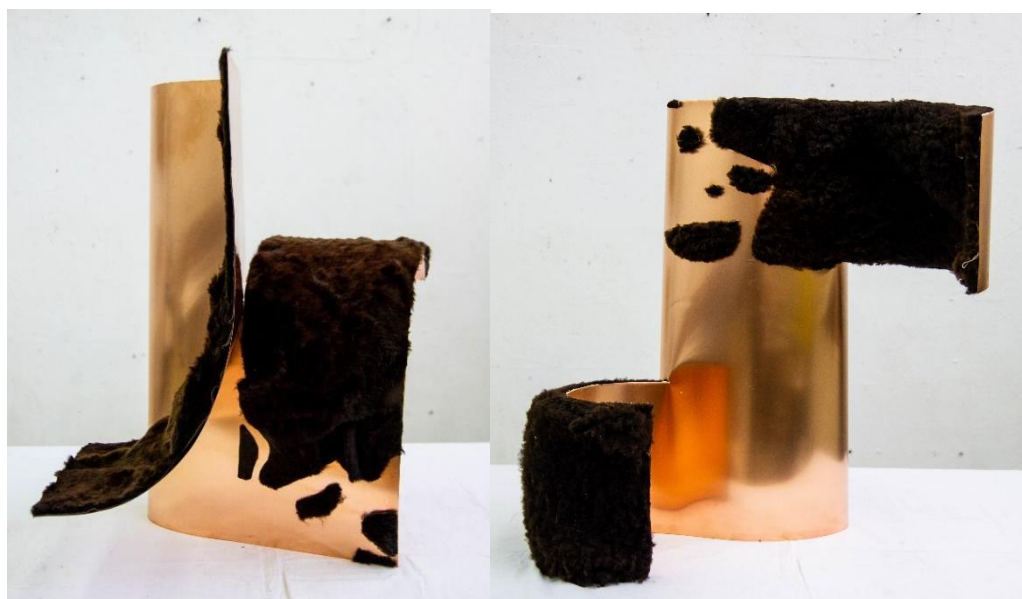
Absztrakt konfiguráció, 100x100x70cm egyenként, vörösréz és báránybunda, 2023