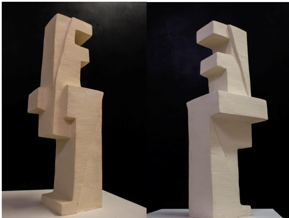
Útjaim, 100x30x30 cm, műgyanta, 2024