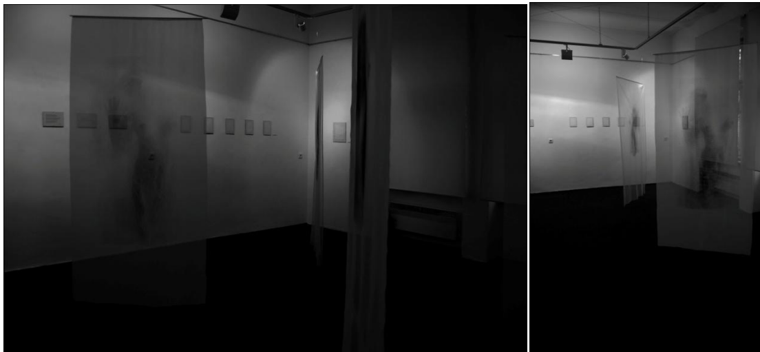
Haáz Rezső Múzeum, Székelyudvarhely

A kiállítás anyagát egy másik installáció is kiegészíti, amely négy darab, a térben elhelyezett, áttetsző textilre, szita technikával nyomtatott, női alakot ábrázol. Ez az akt egyik kezét felemeli és mintha egy üveg felülethez vagy valamilyen áttetsző testhez lenne tapadva egész testével, éppen a menekülés pillanatában ábrázolva, menekülve a falanszter világból, vagy abból, amiben él vagy éppen önmaga elől, az értelmezés a nézőre van bízva.