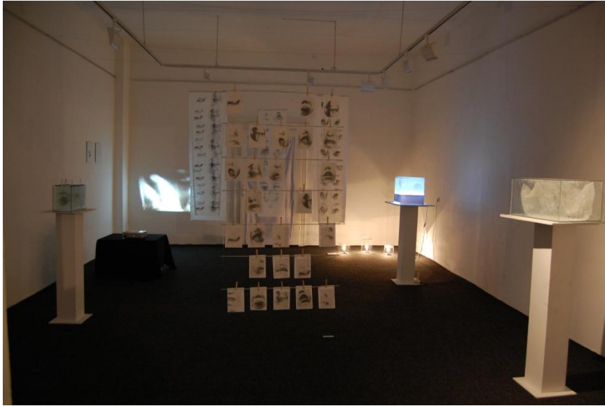
Székelyudvarhelyi kiállítás, Haáz Rezső Múzeum

A kiállítás anyagát egy másik installáció is kiegészíti, amely négy darab, a térben elhelyezett, áttetsző textilre, szita technikával nyomtatott, női alakot ábrázol. Ez az akt egyik kezét felemeli és mintha egy üveg felülethez vagy valamilyen áttetsző testhez lenne tapadva egész testével, éppen a menekülés pillanatában ábrázolva, menekülve a falanszter világból, vagy abból, amiben él vagy éppen önmaga elől, az értelmezés a nézőre van bízva.