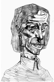
NENAD VUKASIN képzőművész (nem beszél)