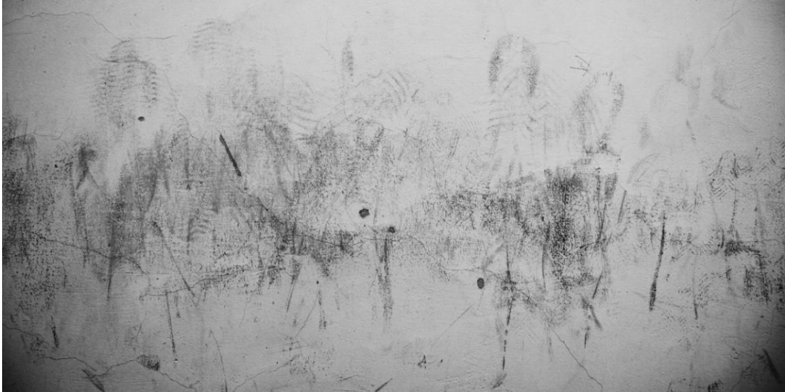
Repose , talált rajz

Az alkotó ösztöndíj nagymértékben elősegítette a jövőben végzett kutatásaim alatt szükséges technikai eszközök beszerzését, valamint az oktatói tevékenységem folytatására is szükséges doktori programra való felkészülésemet.